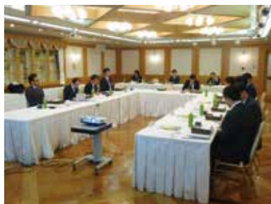
自治体との意見交換会