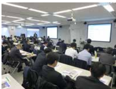
都市環境エネルギー技術研修会