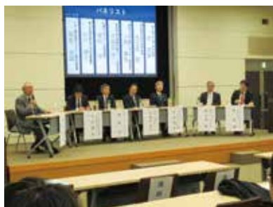
都市環境エネルギーシンポジウム